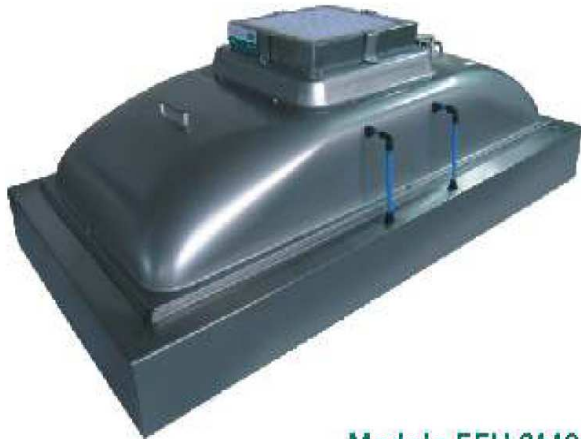
Modelo FFU 2448